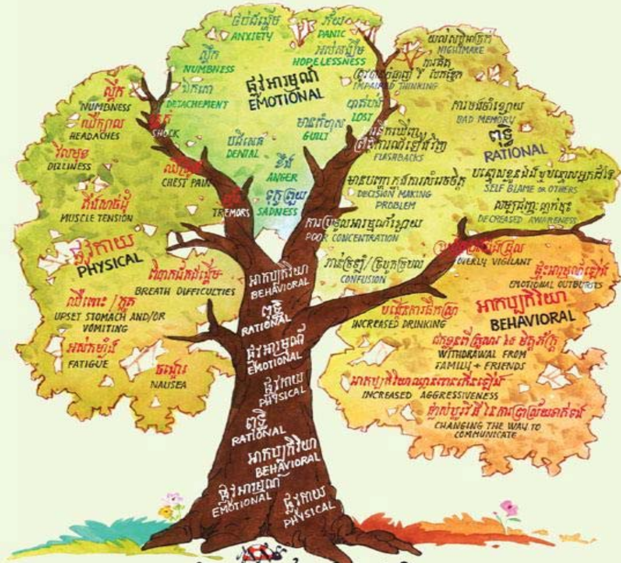
ព្រឹត្តិការណ៍ប៉ះទង្គិចផ្លូវចិត្ត TRAUMATIC EVENT